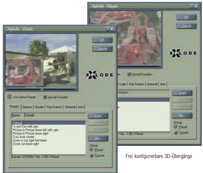
Frei konfigurierbare 3D-Übergänge