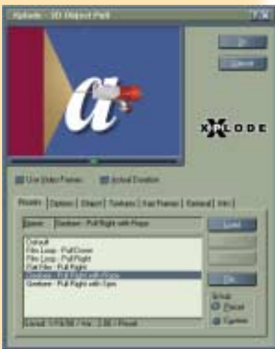
Import von Objekten aus 3DStudio und Lightwave