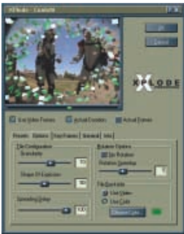
Frei konfigurierbare Effekte