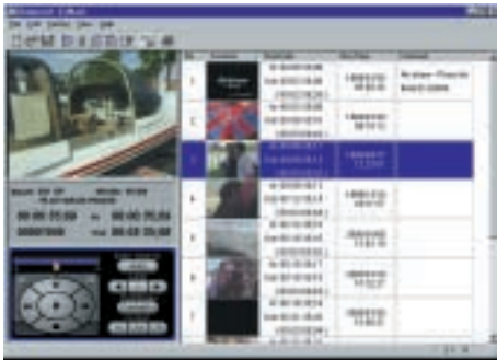
Szenekatalog-Erstellung mit Easy Navigator