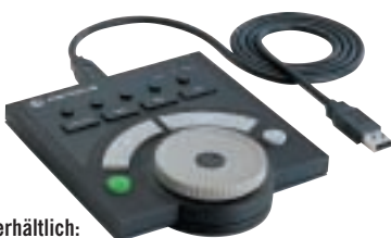
Optional erhältlich: Jog-Shuttle JD-1

die ideale Ergänzung zu EZEdit, MediaStudio u. Premiere