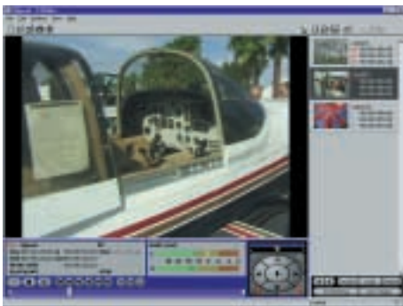
Capturing und Ausgabe mit Easy Video